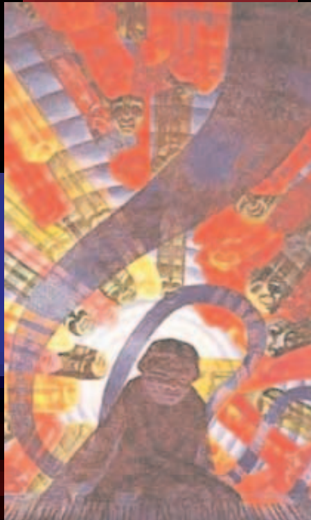
LUIGI RUSSOLO / ORGANPLAYER L'ARTE DEI RUMORI. MANIFESTO FUTURISTICO. 1913

DIESEN UMSTAND ERKANNTEN ZUR VORIGEN JAHRHUNDERTWENDE JOSEF MATHIAS HAUER, DER DIE TOTALITÄT DER MUSIK IN ALLEN IHREN MÖGLICHEN KONSTELLATIONSBILDUNGEN IN SEINER TROPENLEHRE DARZUSTELLEN VERSUCHTE. SEINE BEGEGNUNG MIT DEM DEUTSCHEN ÜBERSETZER DES I-GINGS, DEM SINOLOGEN RICHARD WILHELM, BRACHTEN IHN IN KONTAKT MIT DEM DENKEN IN GROSSEN ZYKLEN UND DEM, WAS DIE CHINESEN „DIE MUSIK DES HIMMELS“ NENNEN. ALS KRÖNUNG SEINER ARBEIT SAH ER DIE ENTDECKUNG DES ZWÖLFTONSPIELES, BEI DEM, ÄHNLICH DER ORAKELBEFRAGUNG DES I-GINGS, ALLE 12 TÖNE IN EINEN ZUFÄLLIGEN ODER BEABSICHTIGTEN ZYKLUS GEBRACHT WERDEN, DER IN EINER ART KONTEMPLATIVEM EXERZITIUM DURCH SPIEGELUNG, DREHUNG ODER UMKEHRUNG GLEICH EINEM KRISTALLINEN GEBILDE AUSGEFORMT WERDEN KANN. SEINE BEGEGNUNG MIT ARNOLD SCHÖNBERG WIRD IN DER MUSIKGESCHICHTE LEIDER UNTER DEN TISCH, BESSER DEN T E P P I C H (OBWOHL ES FLIEGENDER WAR) GEKEHRT.