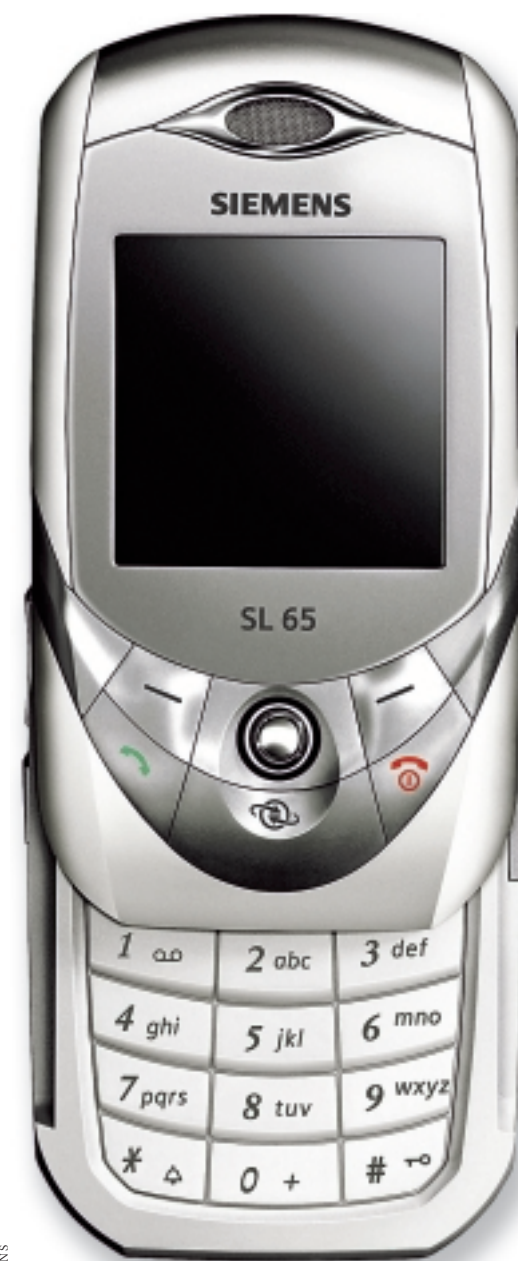
SL65: Integrierte Digicam mit Fünffach-Zoom

Siemens bringt „Slider“-Telefon SL65 auf den Markt